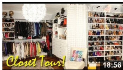
Camila Coelho apresenta seu Closet