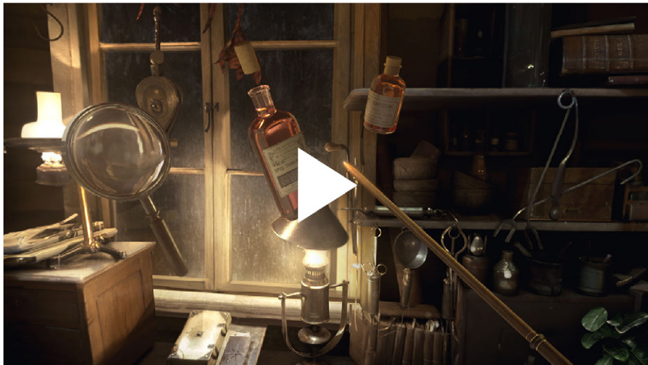
“Фантастические твари” в виртуальной реальности в Daydream

Предлагайте зрителям возможность совершать действия и принимать решения, и им захочется задержаться в вашем виртуальном мире. По словам одного из участников исследования, “лучшие видео – это те, в которых ты сам что-то делаешь, в которых можно перемещаться и управлять происходящим”. Однако интерактивная виртуальная реальность требует использования соответствующих технологий, расплачиваться за которые приходится доступностью контента.