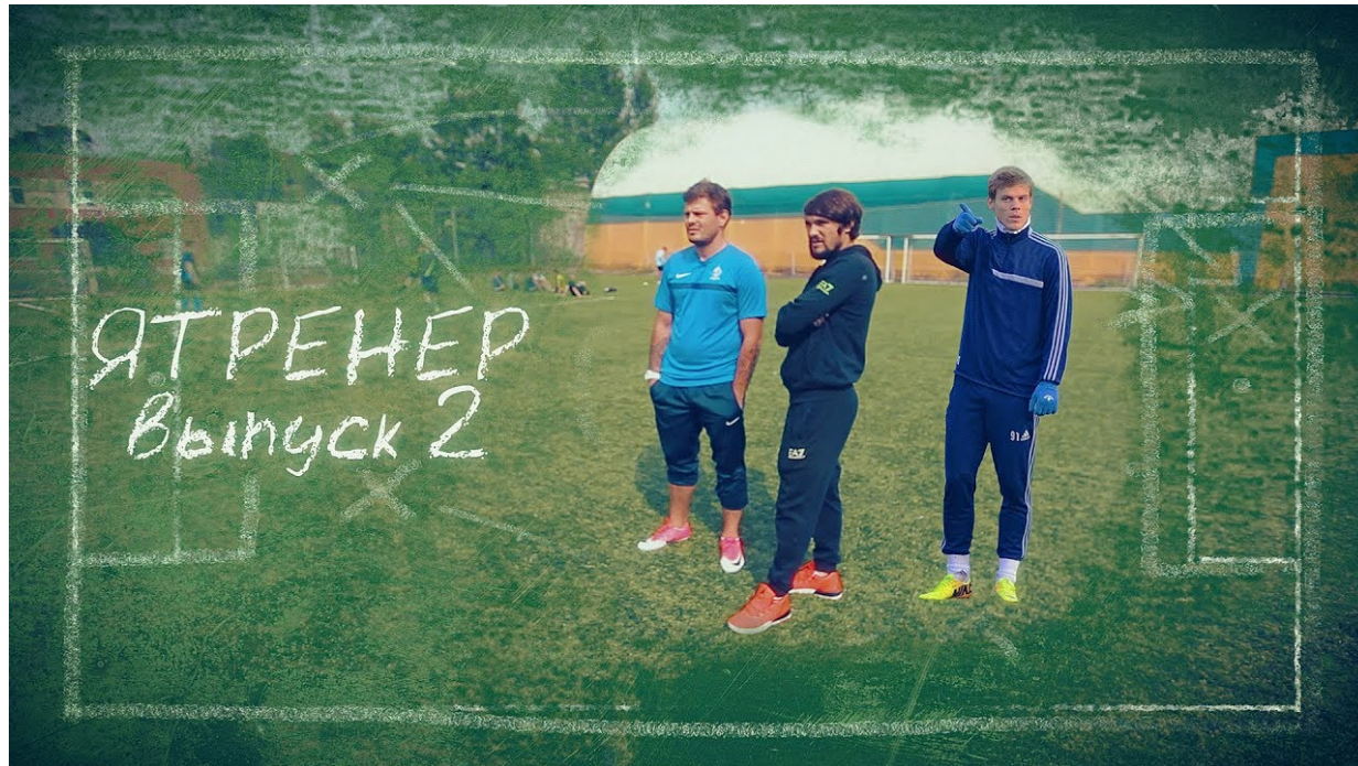
Проект “ЯТРЕНЕР” / Картавый футбол