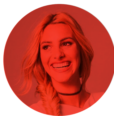
8. Lele Pons