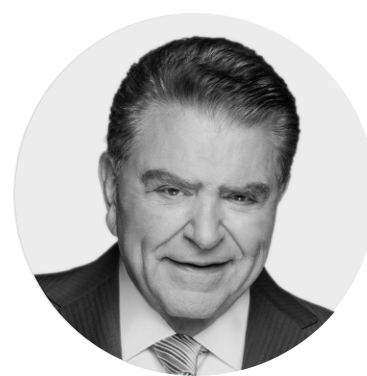
9. Don Francisco