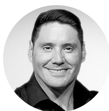
1. Francisco Saavedra

4 de las 10 personalidades más influyentes del mundo del espectáculo son YouTubers, para los encuestados entre 14 y 35 años