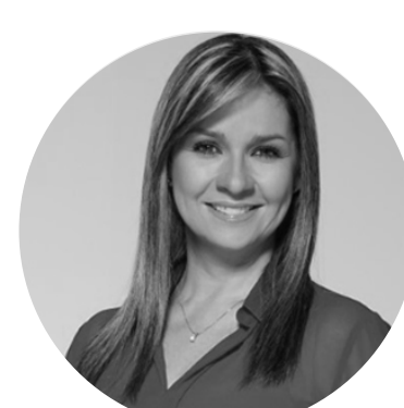
10. Vicky Dávila

Las personalidades de Internet suelen verse más cercanas y reales