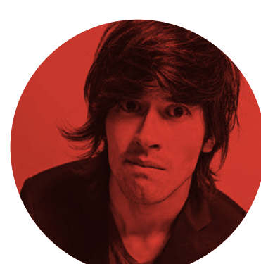
8. Hola Soy German