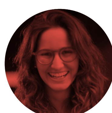
4. La Pulla