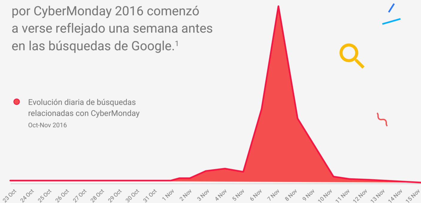
● Evolución diaria de búsquedas relacionadas con CyberMonday Oct-Nov 2016

Las búsquedas relacionadas con CyberDay/ CyberMonday aumentan cada año y el día Lunes sigue siendo el más relevante del evento. 1